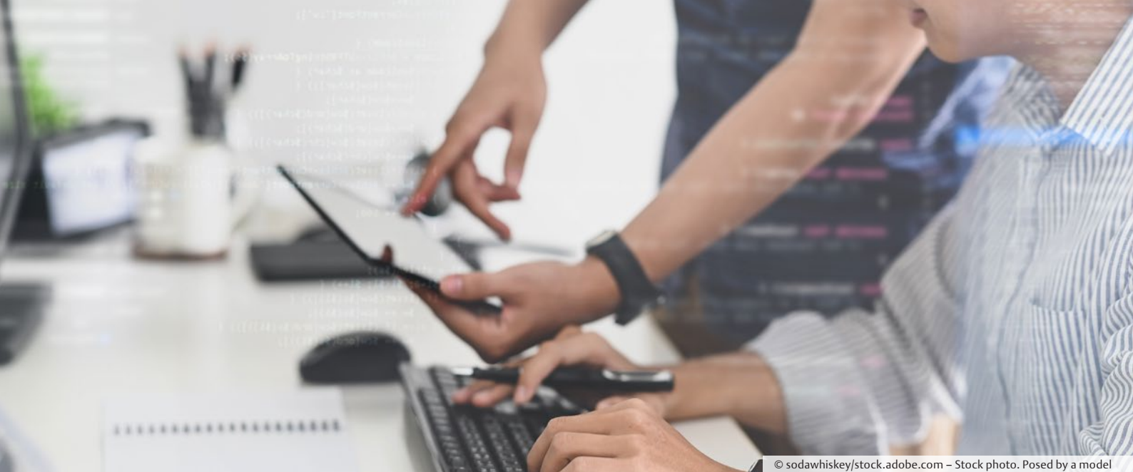
Stock photo. Posed by a model